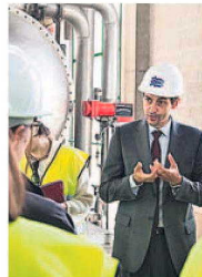
Una clase en la Escuela del Agua.

gorías: de máster y posgrado (12 en total) y de módulos de posgrado (20 en total). Y cuentan con dos convocatorias: una cuyo periodo de presentación de solicitudes finaliza el 12 de febrero, y otra cuyo periodo de presentación de candidaturas se mantendrá abierto entre junio y mediados de septiembre de este año. Este programa de becas cuenta con el reconocimiento de créditos por la Universidad Politécnica de Cataluña y la Universidad Oberta de Cataluña.